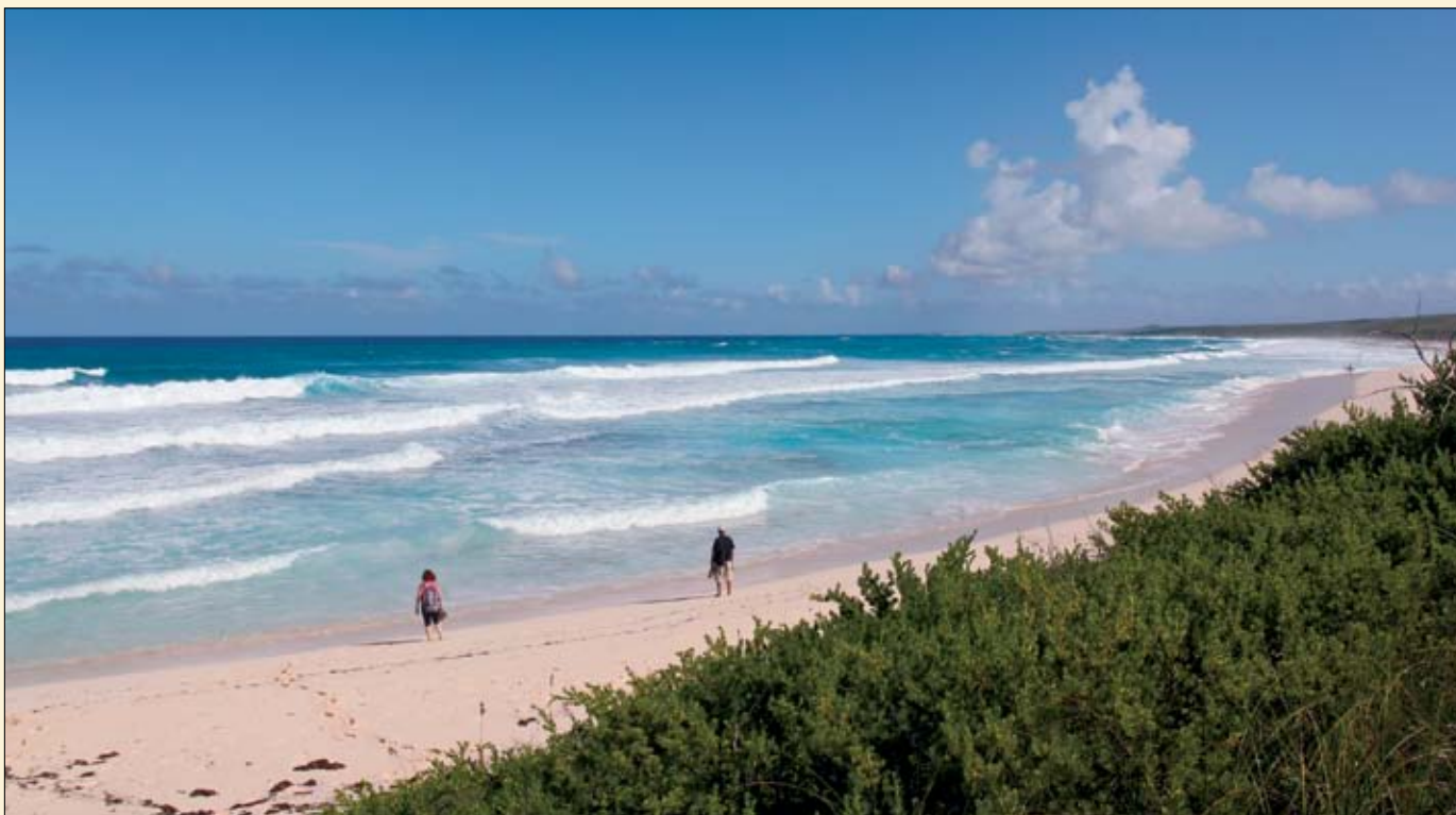
Hamilton Land Beach, la magnifique plage des amateurs de surf.

haut du promontoire rocheux qui domine le pont, le panorama embrasse tout l'horizon. À l'est, la houle respire avec brutalité et monte à l'assaut de la falaise, incessante marmite liquide bleu sombre ourlée d'écume. À l'ouest, les eaux calmes du banc, deux mondes séparés par une étroite arête rocheuse.