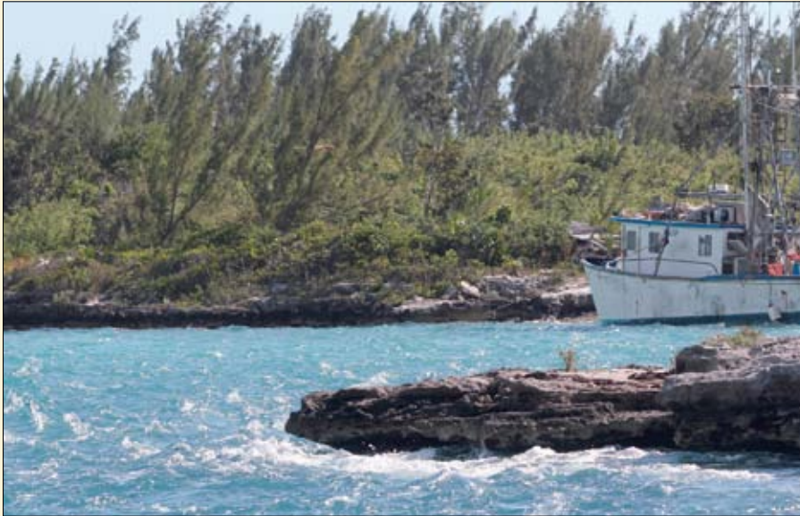
La passe de Current Cut où la vélocité du courant est visible en surface.

souper pour les convaincre de la valeur de la chair délicate de ce poisson mal connu... pour lequel il faut néanmoins s'armer de patience lorsque vient le temps de tirer des filets dignes de ce nom.