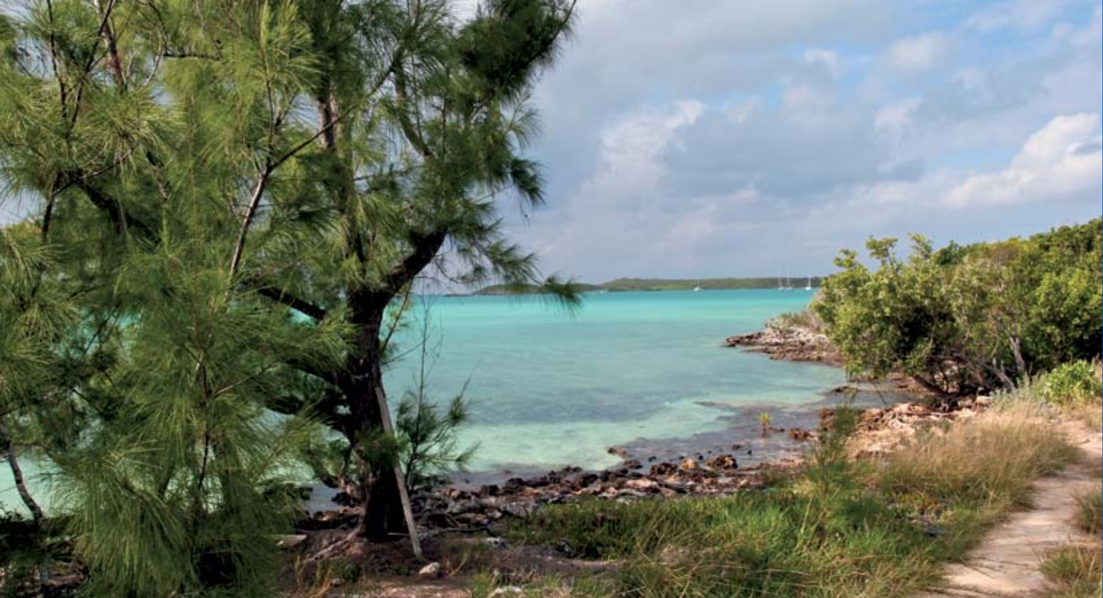
Contrastes de vert sur le sentier qui traverse Royal Island. On aperçoit le mouillage au fond.