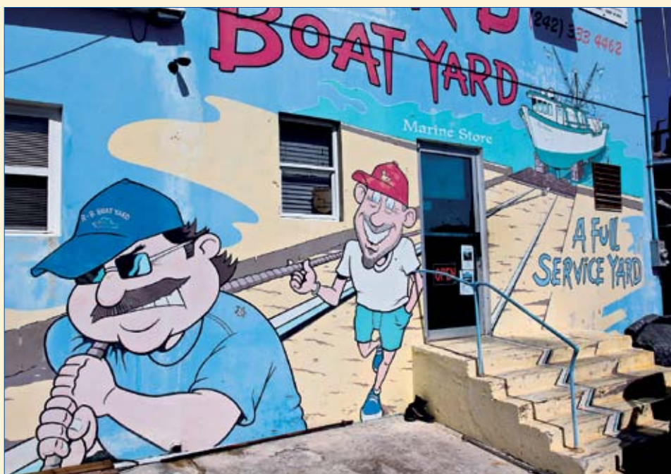
La façade du magasin de marine du chantier naval de Spanish Wells.

La petite localité s'accroche sur une île sablonneuse de 3 km de long sur à peine 800 m de large. Deux épiceries et une poissonnerie permettent de s'y ravitailler et l'on trouve aussi deux restaurants à proximité de Shipyard Point. Tout le monde ou presque y circule en voiturettes de golf entre les maisons colorées, parfois entourées de champs de courges ou de jardins où fleurissent bananiers, papayers et citronniers. La côte au vent n'est qu'une longue plage de sable fin quasiment déserte, comme