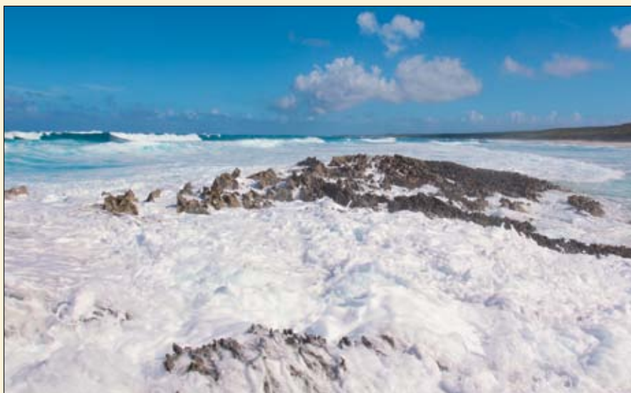
Symphonie d'écume sur les rochers d'Hamilton Land Beach.

La petite péninsule de Cupid's Quay, site historique de la première implantation coloniale, abrite les plus anciennes maisons de la ville, mais le quartier est amoché et vaguement dépenaillé. Juste en face trône en revanche Haynes Library, joli bâtiment d'inspiration coloniale construit en 1897. La façade rose de la bibliothèque