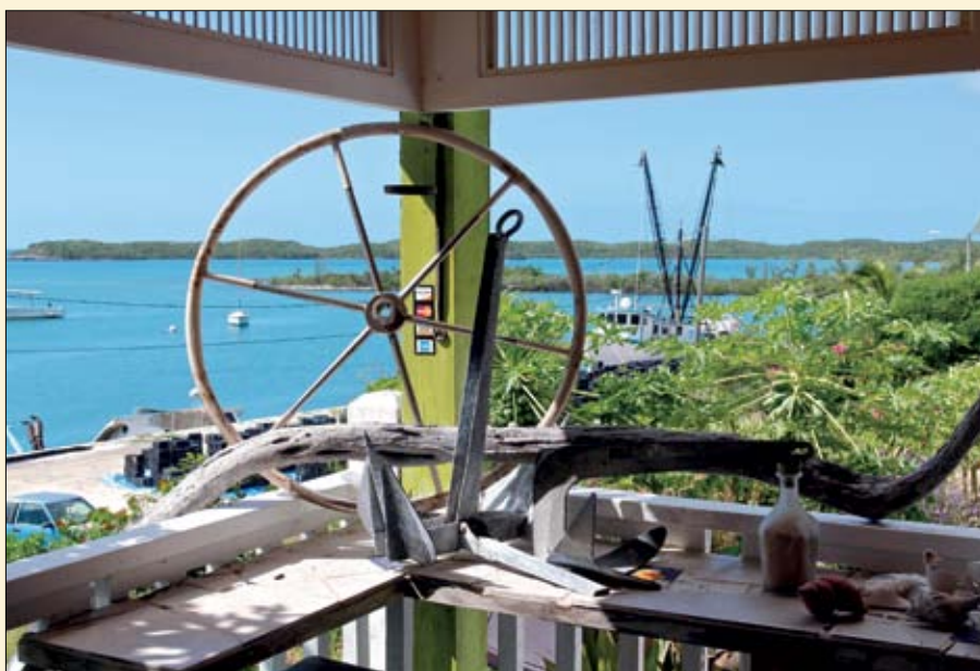
Hatched Bay Harbour vu depuis la terrasse du bistrot au-dessus du port.

la navigation bahamienne. Leur étroitesse génère des vélocités de courant qu'il vaut mieux prendre au sérieux. Par vent fort contre courant, ces passages peuvent prendre des airs de rodéo. Nous luttons effectivement au moteur contre 5 nœuds de courant pendant quelques minutes, mais de l'autre côté, c'est la récompense. Une brise d'une dizaine de nœuds s'est levée et nous naviguons à bonne allure sur une mer des plus dociles. La navigation sur les eaux vertes du banc, sous le vent des îles, pourrait donner