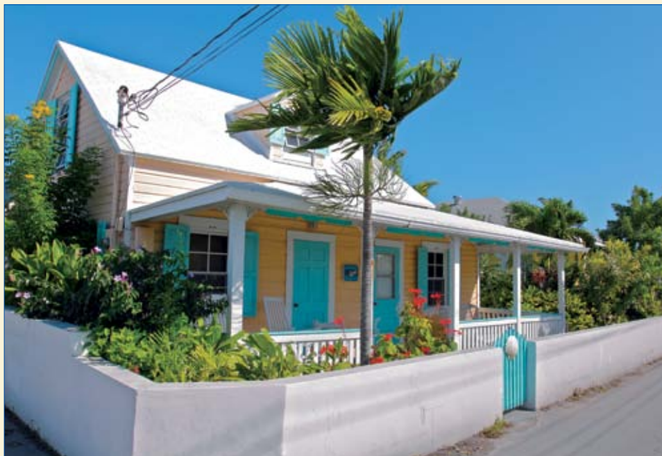
La petite communauté de Spanish Wells est aussi un site de villégiature de quelques habitués du coin. Certains résidents y cultivent un goût marqué pour la couleur.

À mer basse dans une grande mer, les quilles frôlent le fond du chenal qui conduit à Spanish Wells. Un courant de 3 nœuds sort de la passe qui fait moins de 40 m de large. On s'y faufile en douceur pour pénétrer dans un canal naturel, offrant de bonnes profond-