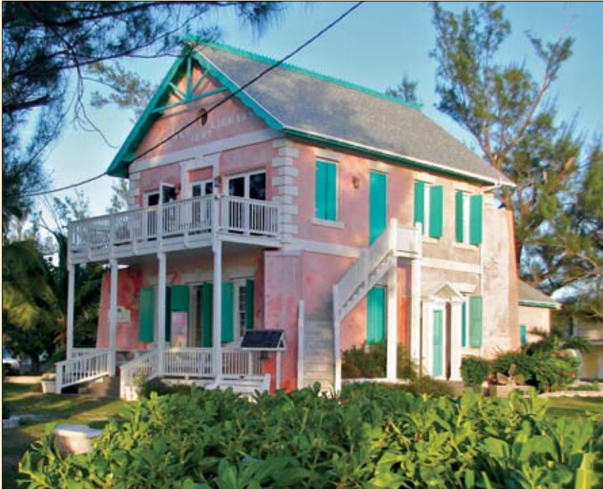
Haynes Library, la bibliothèque municipale de Governor's Harbour.

rénovée dans les années 1990 est devenue l'un des points de repère et la fierté de la petite localité.