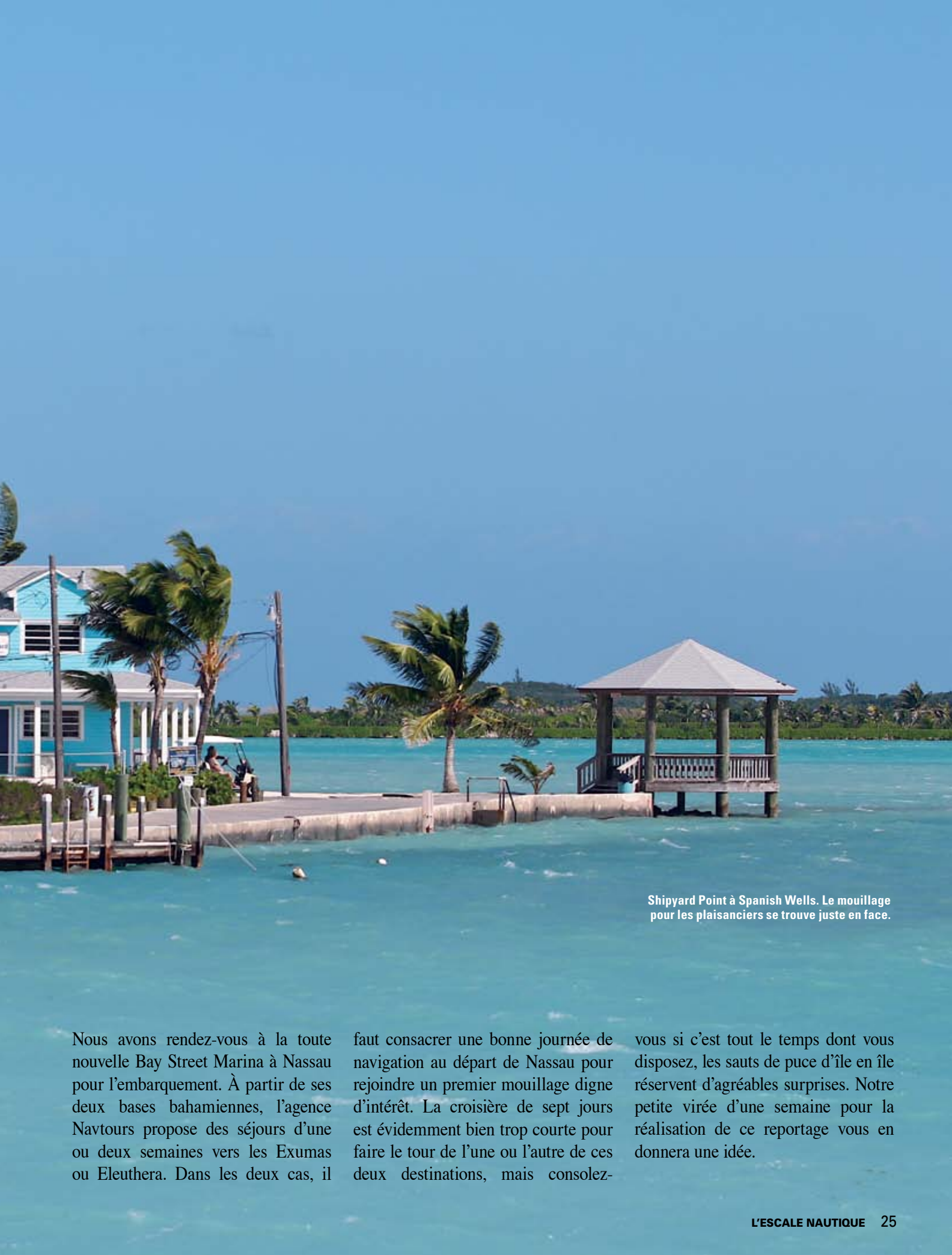
Shipyard Point à Spanish Wells. Le mouillage pour les plaisanciers se trouve juste en face.

Nous avons rendez-vous à la toute nouvelle Bay Street Marina à Nassau pour l'embarquement. À partir de ses deux bases bahamiennes, l'agence Navtours propose des séjours d'une ou deux semaines vers les Exumas ou Eleuthera. Dans les deux cas, il