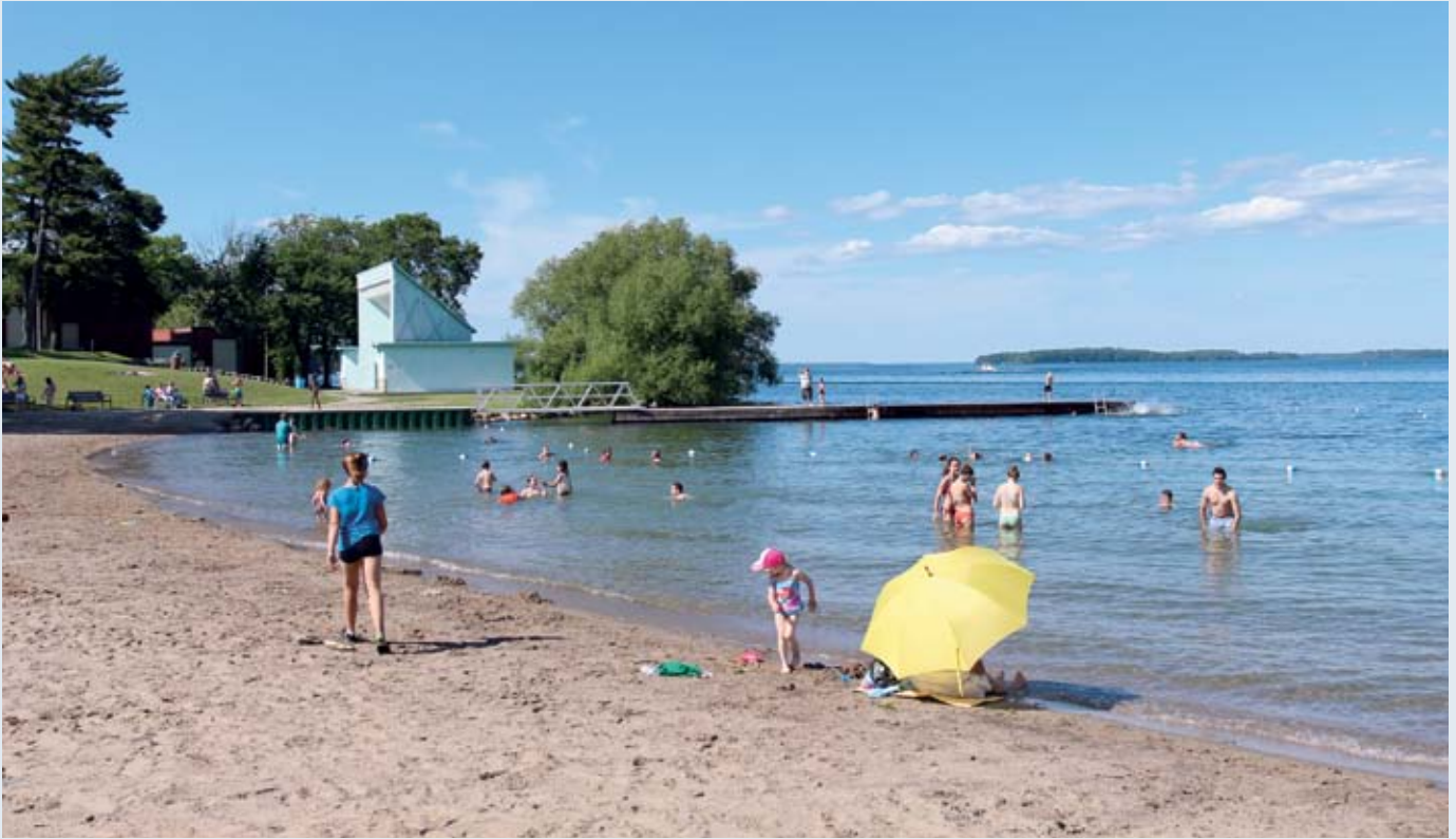
La jolie plage d'Orillia dans le lac Couchiching est à deux pas de la marina.