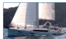
41 Beneteau 2014 en démonstration. Mât classique, 2 cabines, Yanmar 40 HP Dodger, Bimini, Propulseur. Possibilité d'échange.