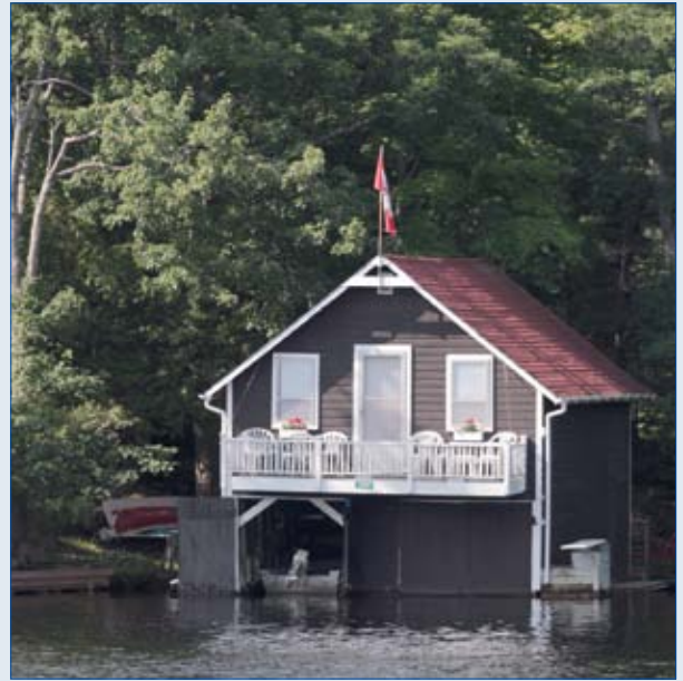
Les abris à bateau, autre élément de charme du paysage des lacs Kawartha.

Nous continuons à remonter le cours de la rivière Otonabee. Après une succession de cinq écluses et un parcours de huit milles, nous touchons la petite localité de Lakefield qui ouvre les portes de la magnifique