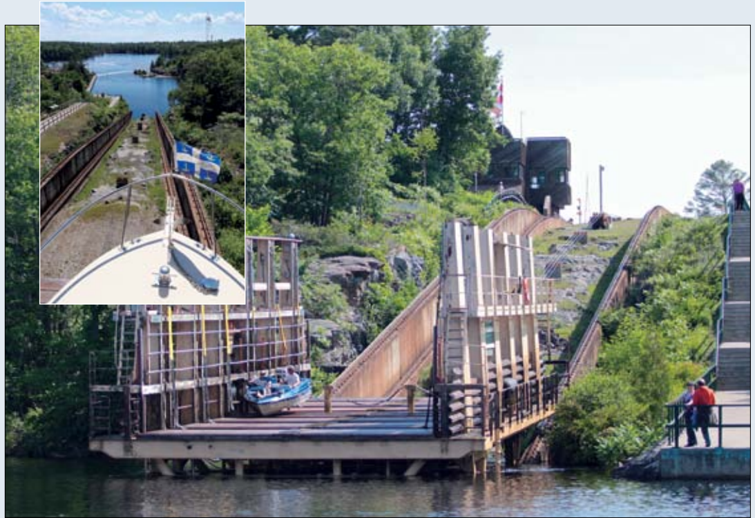
Le ber roulant de Big Chute.

Le ber roulant de Big Chute est une autre mécanique à sensation qui fait l'orgueil de la voie navigable. Plutôt que de dynamiter des tonnes de rocher pour creuser une écluse à côté de la chute où se jette la rivière Severn, on a plutôt opté pour la construction d'un ber roulant sur des rails. Le ber s'immerge à la manière d'une cale sèche flottante et immobilise les bateaux par un système de sangles et de supports de retenue. Monté sur une double série de rails décalés dans l'axe vertical, le chariot roulant dévale en douceur une dénivellation de 18 m tout en demeurant dans un plan horizontal. Cet ingénieux dispositif, mis en