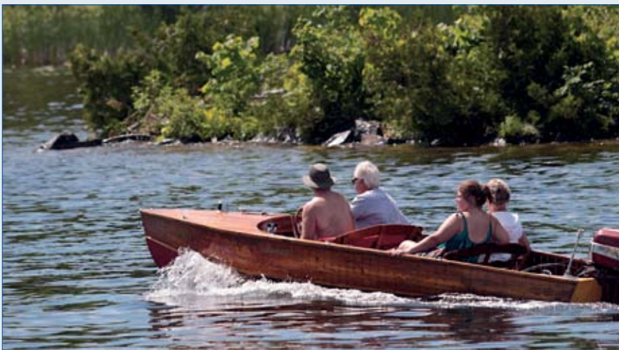
Les canots automobiles d'époque font partie intégrante de l'histoire du yachting de la région de Peterborough.

Cette carte postale canadienne qui déroule son paysage pittoresque sur des eaux