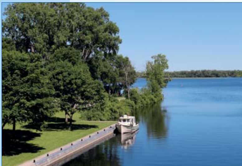
Les abords de l'écluse de Percy Reach dans le décor sauvage du marécage Murray.

I l aura fallu pas moins de 87 ans pour construire un système de canalisation reliant le lac Ontario et le lac Huron. Née des craintes d'une invasion américaine, comme le canal Rideau, la voie navigable Trent-Severn chemine sur plus de 200 milles nautiques (386 km). Elle emprunte le parcours très sinueux des rivières Trent à l'est et Severn à l'ouest qui relient entre elles des dizaines de lacs. Une cinquantaine de Km de canalisations ont été creusées pour achever cet ambitieux projet – qui comporte pas moins de 42 écluses – et qui ne servit cependant aucun des intérêts qui avaient motivé sa construction.