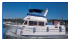
35 Oceania Trawler 1986 Diesel 135 HP Perkins, génératrice, air climatisé. Rénové 2014 très propre. 64,000$ hors taxes. Possibilité d'échange.