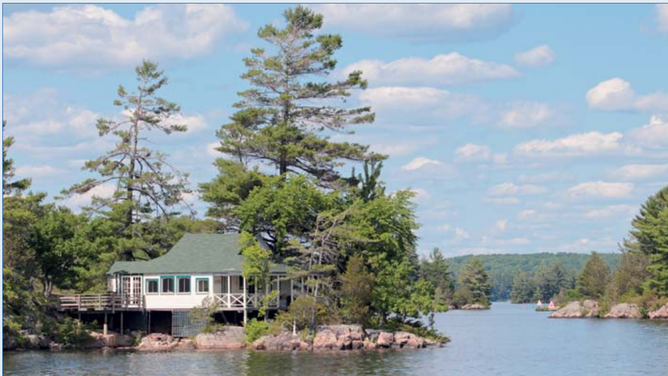
Le merveilleux décor du lac Stony, l'un des plus beaux paysages de la voie navigable.

navigation de plaisance, notamment dans la région de Peterborough, constitueront la planche de salut de la voie navigable, aujourd'hui administrée par Parcs Canada. La Trent-Severn est devenue célèbre à la grandeur du monde pour ses deux écluses à ascenseur hydraulique de Kirkfield et Peterborough et pour l'étonnant ber roulant de Big Chute. Des ouvrages que l'on décrit comme un témoignage significatif des merveilles d'ingénierie de l'époque victorienne. Pour s'élever