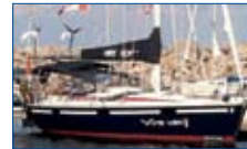
39 Oceanis 390 1988 Yanmar 40 HP (2003), peinture Awl-Grip (2013) Radar, pilote, GPS, dodger, bimini. Rénové, très propre, excellente condition, 99,500$ taxes payées.