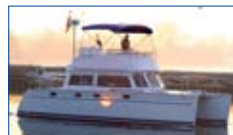
34 PDQ 2006 Catamaran à moteur Moteurs Yanmar 100 HP (850 heures) Génératrice 5Kw, air climatisé, radar, autopilote. Excellente condition, 349,000$ taxes payées.