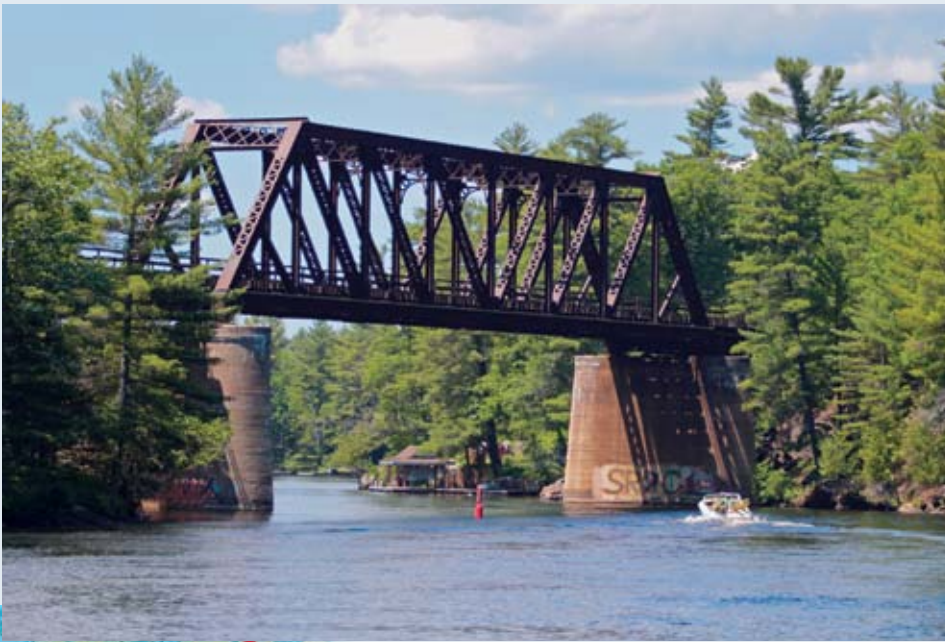
La rivière Severn présente plusieurs passages resserrés particulièrement pittoresques.

érigeant une immense statue à son effigie face à la jolie plage de sable. Orillia mérite bien une petite balade en ville. On a d'abord l'agrément de s'amarrer dans une marina toute neuve fort bien équipée. Et de là, on peut partir le long de la rue principale à la découverte d'un patrimoine bâti du XIX e siècle non dénué d'intérêt.