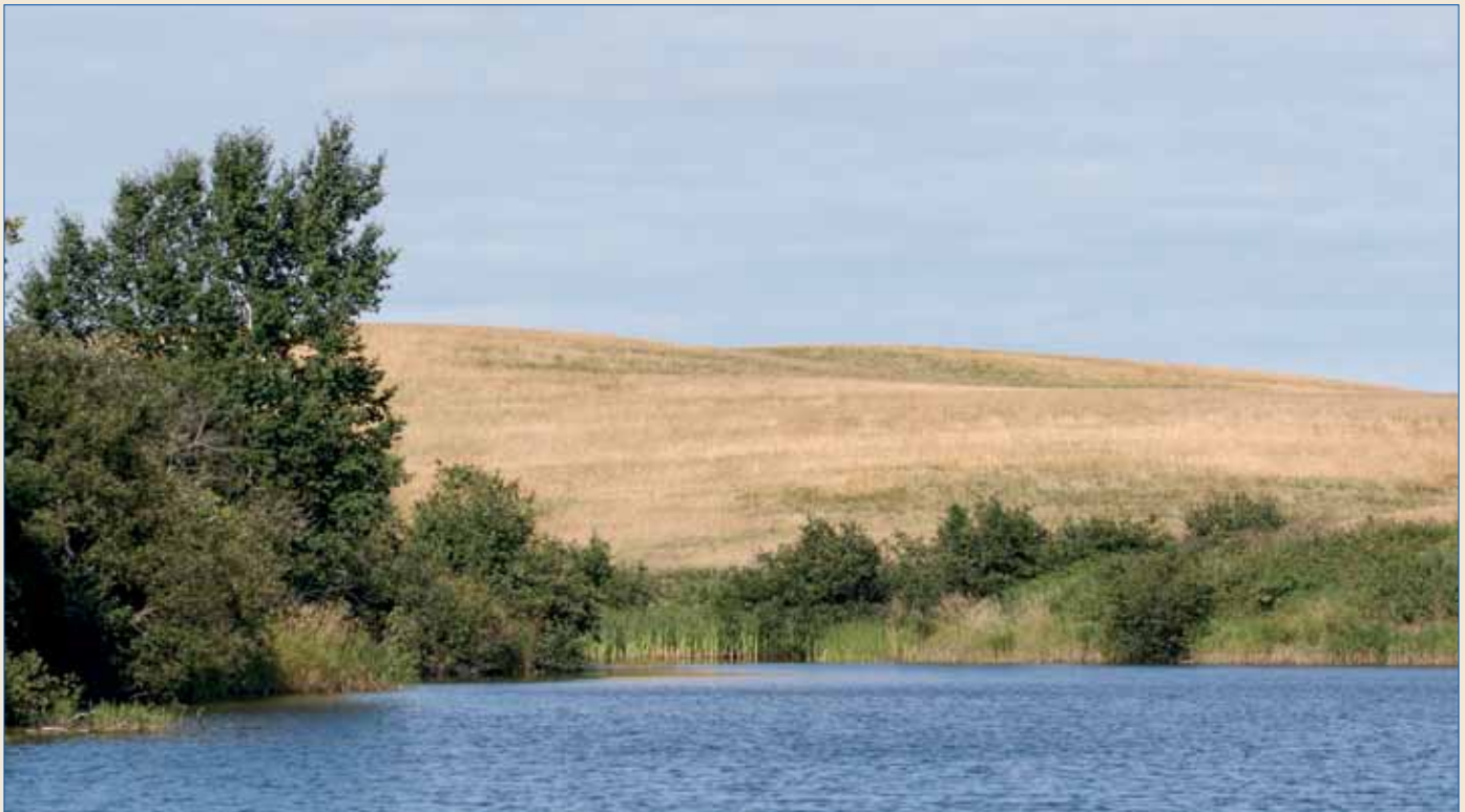
La rivière aux Harts offre un mouillage agréable en pleine campagne.

au Québec, accueille ses clients avec une verve théâtrale. Volubile et convivial, il parle autant avec sa bouche qu'avec ses mains.