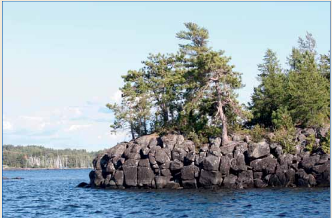
Le littoral rocheux de la rive Est présente une série d'îles au caractère sauvage. Au second plan, la baie Gaudreault où se trouve le Club de voile des Îles.

En se tenant bien au centre du chenal naturel, on trouve facilement le Club nautique de Péribonka sur la rive Nord. Un petit club très correct et bien protégé au centre du village. La couleur locale, nous l'avons trouvée au