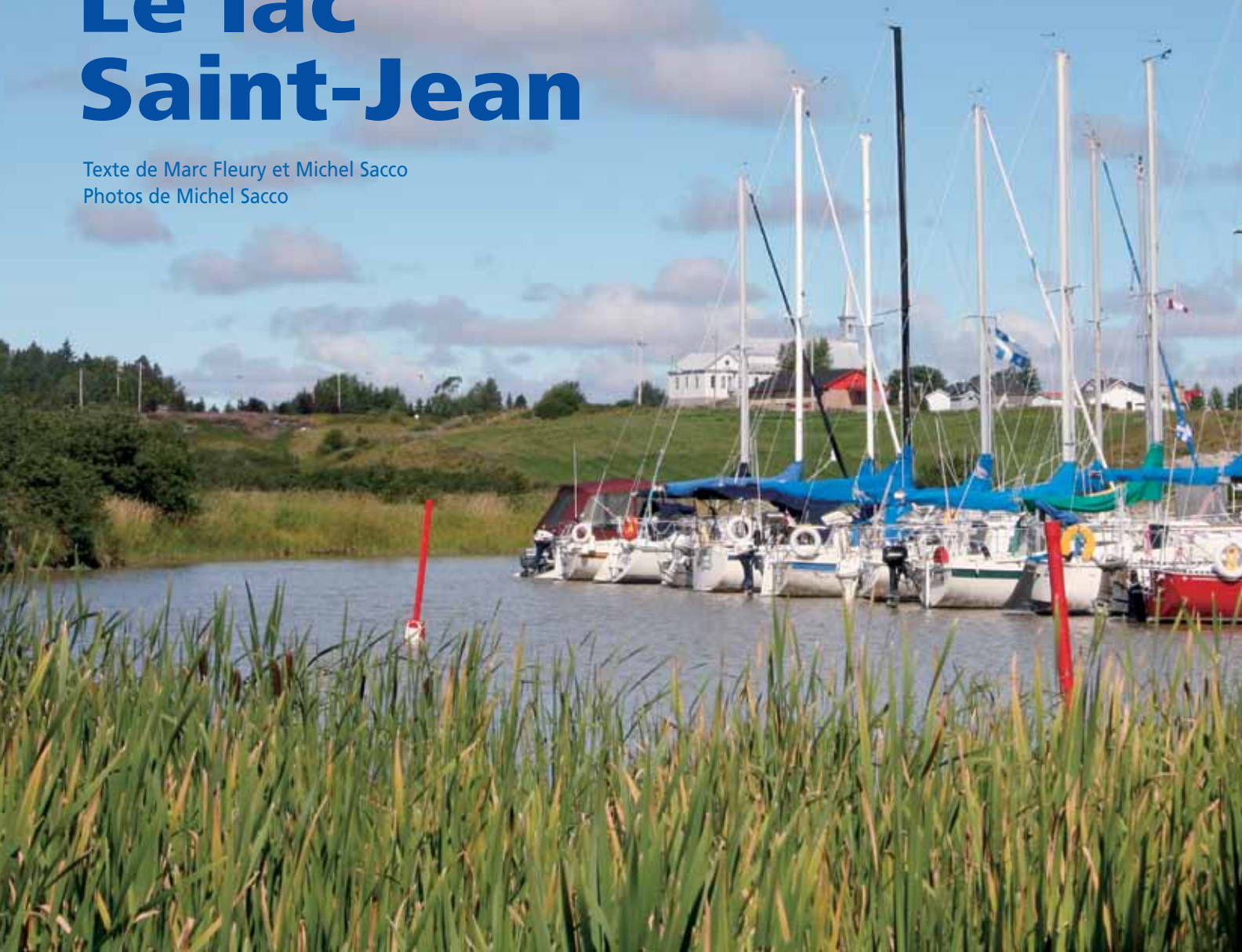
Le joli bassin de la marina de Saint-Henri-de-Taillon.

Texte de Marc Fleury et Michel Sacco