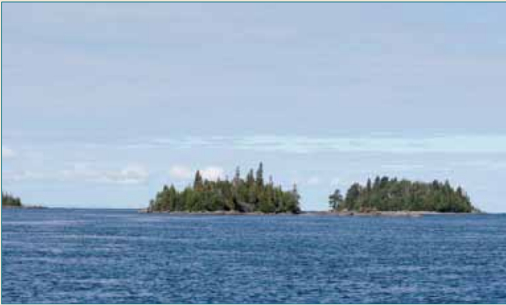
Le secteur de la Passe du Lac à la sortie de la Grande Décharge.