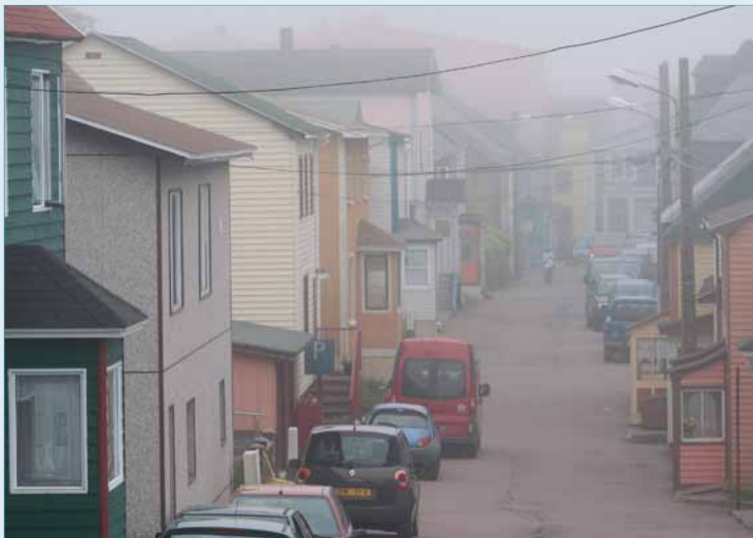
Le centre-ville de Saint-Pierre dans la brume de juillet.