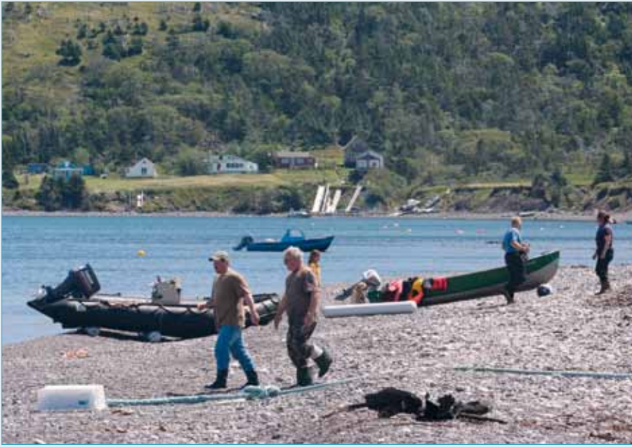
L'anse du Gouvernement à Langlade où se rassemble une petite communauté de villégiateurs à la belle saison.