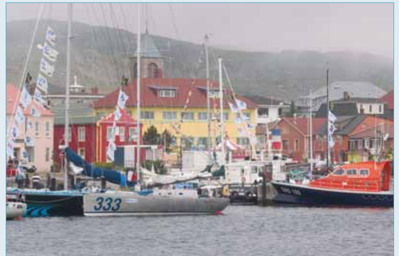
Le port de Saint-Pierre.

Un peu partout dans l'archipel on trouve ces cabestans manœuvrés manuellement pour hisser les embarcations sur la grève. Au fond de la rade de Saint-Pierre, les petites embarcations de pêche sportive ont peu à peu remplacé les doris.