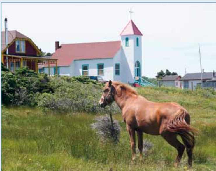
La petite chapelle de l'anse du Gouvernement.

faire en 1763 pour préserver l'existence des pêcheries françaises au terme de la guerre de Sept Ans. La crise des pêches contemporaine n'aura finalement laissé à l'archipel qu'une mince bande de 200 milles de long par cinq de large où il peut exercer sa souveraineté. Les hasards de l'histoire nous ont surtout légué un peuple singulier et attachant, descendant de Basques, d'Acadiens, de Bretons et autres Normands, tous gens de mer dont les racines plongent dans les eaux de l'Atlantique. Un pays où les marins se sentiront toujours chez eux.