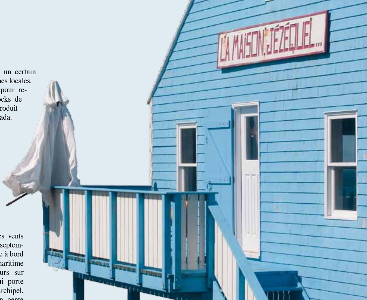
La Maison Jézéquel, café et centre d'interprétation.