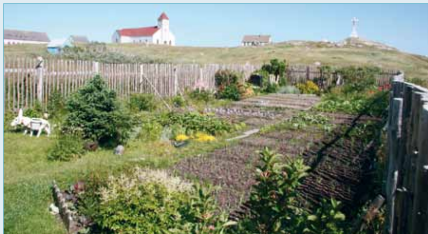
Saint-Pierrais et Miquelonnais ont appris à cultiver tout ce que la nature pouvait leur fournir. Ici, un jardin sur l'île aux Marins.