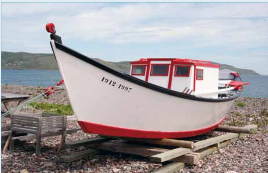
Le doris cabiné, une invention des pêcheurs miquelonnais des années 1950.

Du haut du cap qui surplombe l'anse de Miquelon, on se trouve sur le seul bout de territoire français à partir duquel on peut apercevoir les côtes de Terre-Neuve. Ce dernier fragment de l'empire colonial français en Amérique fut la seule concession que les Britanniques acceptèrent de