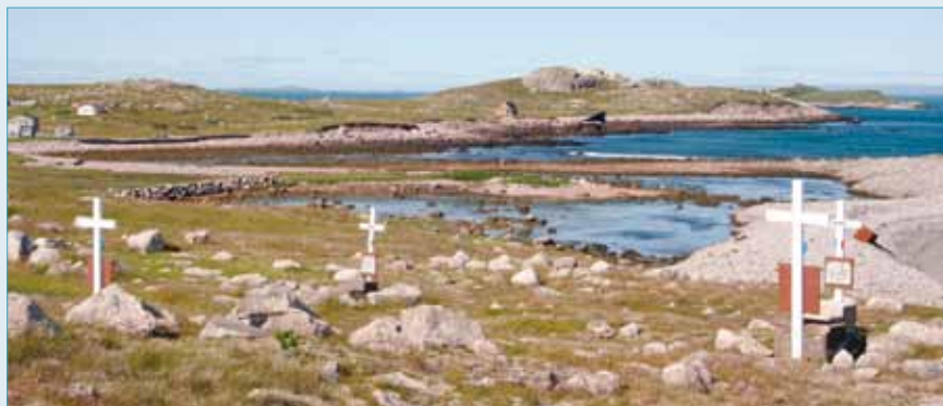
Le cimetière de l'île aux Marins.