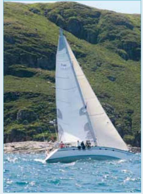
Un voilier devant l'île du Grand Colombier.