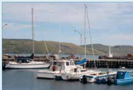
Le port de Miquelon peut accueillir des bateaux de plaisance.

On peut mouiller dans l'anse de Miquelon qui offre un bon abri contre les vents d'ouest, mais qui est complètement ouverte au secteur E. Un brise-lames et des enrochements protègent le petit port de Miquelon, qui offre quelques emplacements aux plaisanciers dans son premier bassin.