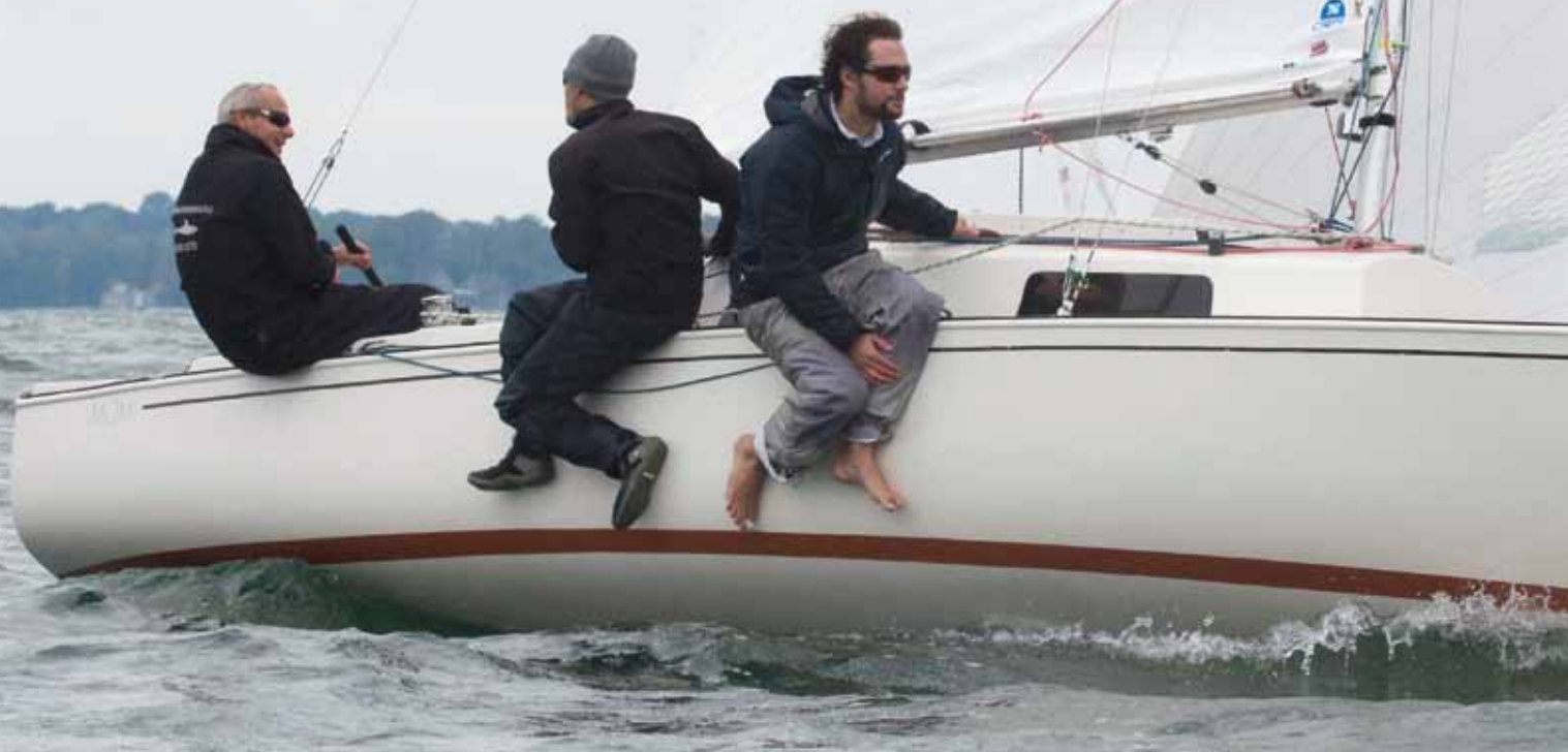
Le Shark Mom en régate sur le lac Saint-Louis. Une allure de jeune homme pour un design de 56 ans d'âge.

Il a plus de 50 ans et il séduit toujours un grand nombre d'adeptes au Québec, au Canada et même ailleurs dans le monde.